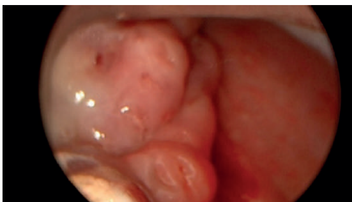
Figure 2. Hypertrophied lingual amygdala in direct laryngoscopy.

The lingual amygdala was ablated with a diode laser at a power of 10 W with a light guide with a cylindrical diffuser (Figure 3). As a result, there is a significant reduction in the size of the lingual amygdala. There was no bleeding during the operation.