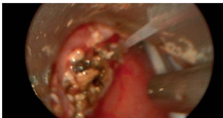
Figure 3. The appearance of the lingual amygdala immediately after laser ablation

A follow-up examination was performed 4 weeks after surgery (Figure 4). There were no complaints at the time of the follow-up examination, there were no bouts of shortness of breath and no nocturnal apnea. There is a significant reduction in the size of the lingual amygdala.